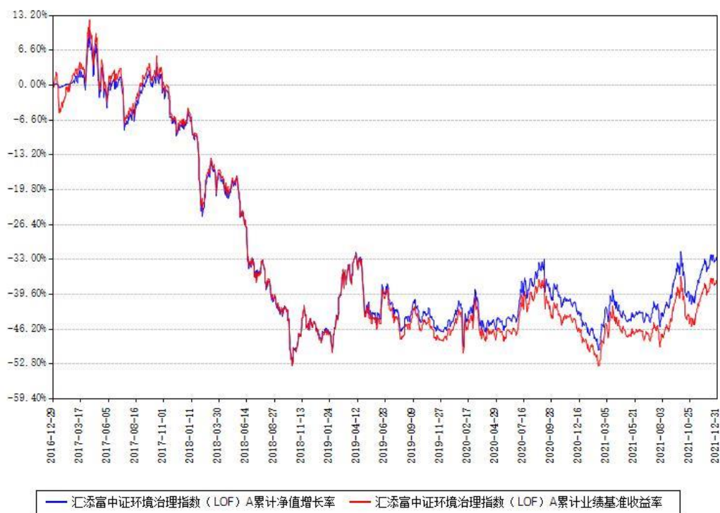
汇添富中证环境治理指数（LOF）A 累计净值增长率与同期业绩基准收益率对比图