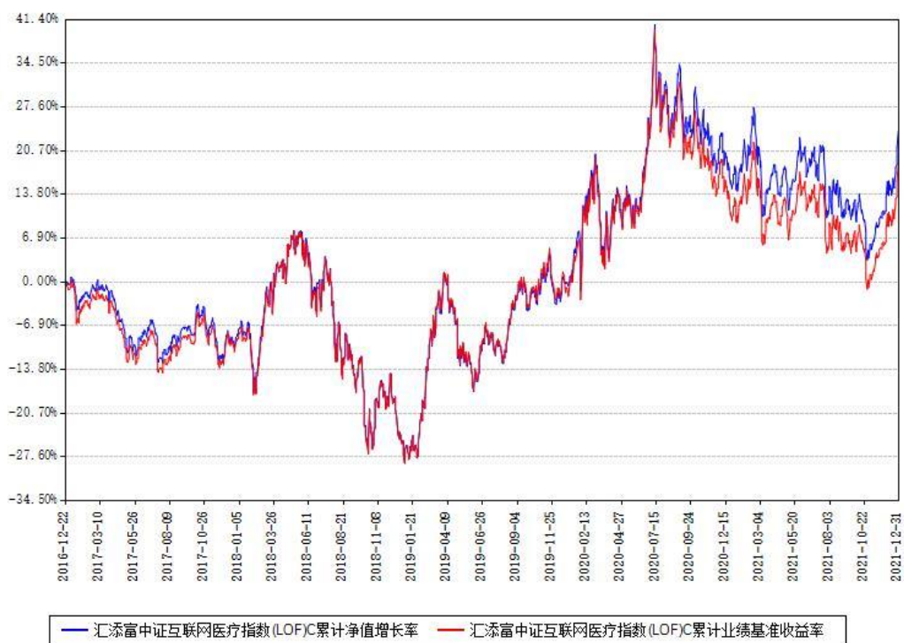
汇添富中证互联网医疗指数(LOF)C累计净值增长率与同期业绩基准收益率对比图