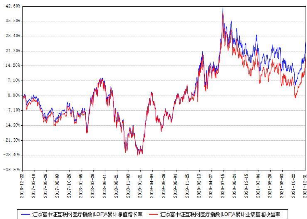
汇添富中证互联网医疗指数(LOF)A累计净值增长率与同期业绩基准收益率对比图