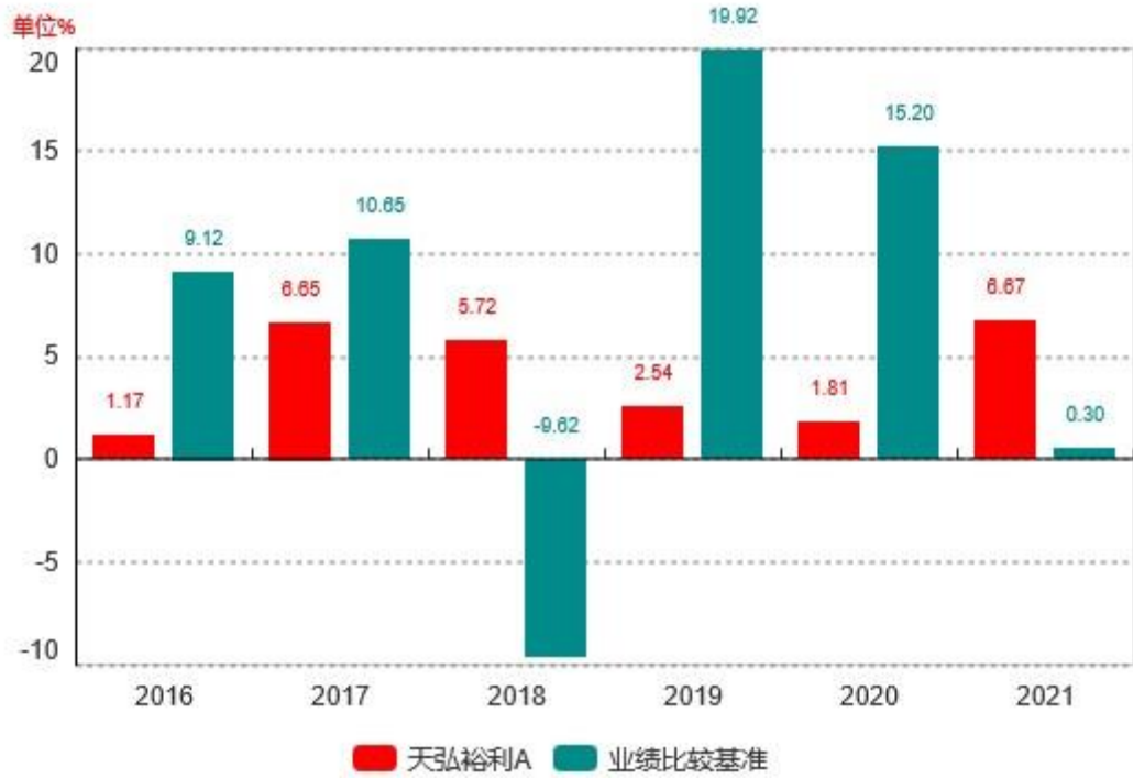
基金的过往业绩不代表未来表现, 数据截止日: 2021年12月31日