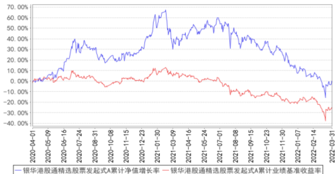
银华港股通精选股票发起式A累计净值增长率与同期业绩比较基准收益率的历史走势对比图