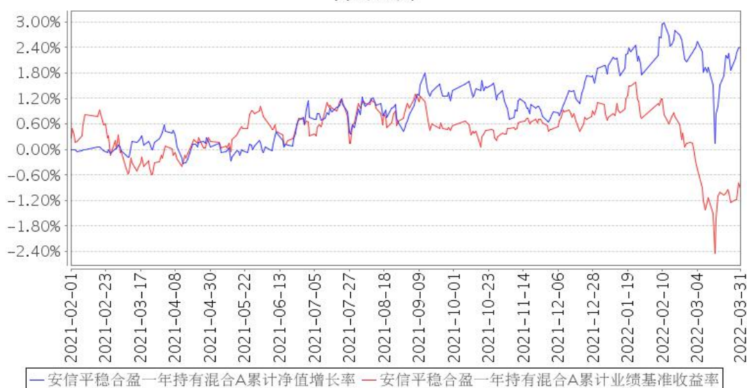
安信平稳合盈一年持有混合A累计净值增长率与同期业绩比较基准收益率的历史走势对比图