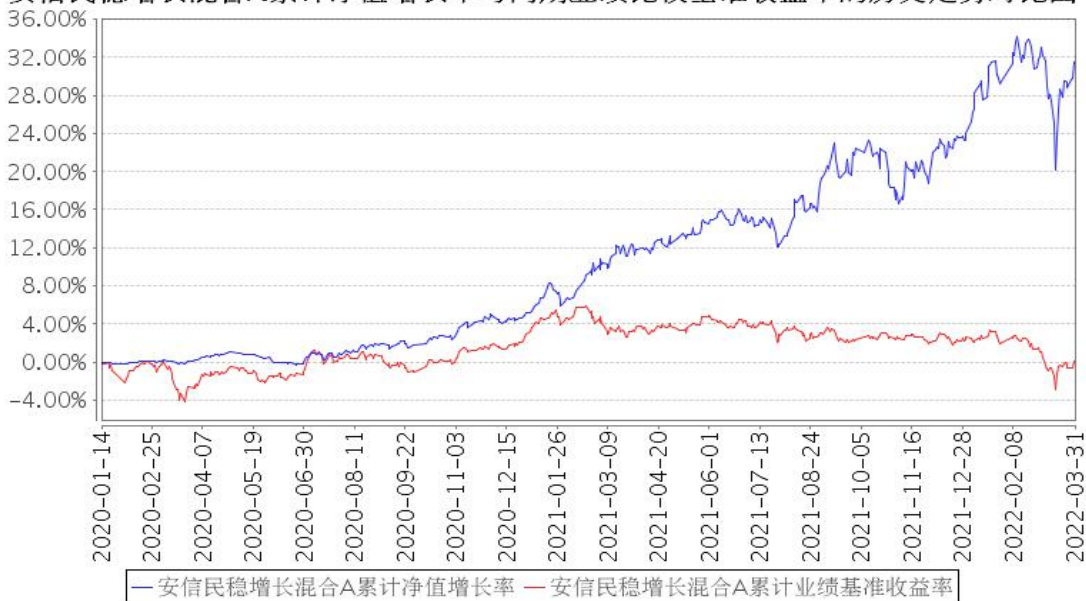
安信民稳增长混合A累计净值增长率与同期业绩比较基准收益率的历史走势对比图