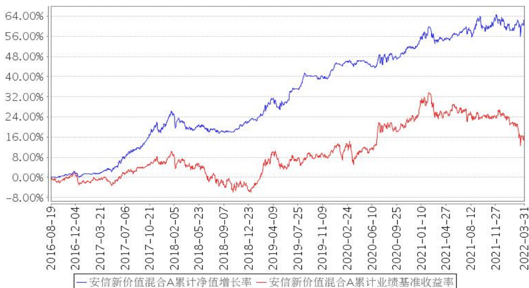
安信新价值混合A累计净值增长率与同期业绩比较基准收益率的历史走势对比图