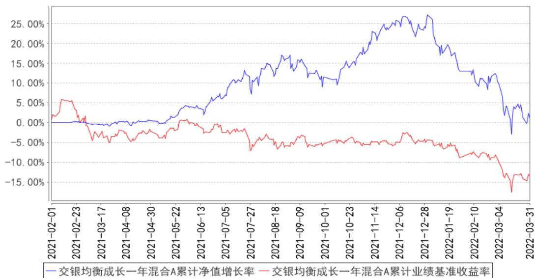
交银均衡成长一年混合A累计净值增长率与同期业绩比较基准收益率的历史走势对比图