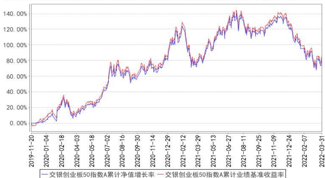
交银创业板50指数A累计净值增长率与同期业绩比较基准收益率的历史走势对比图