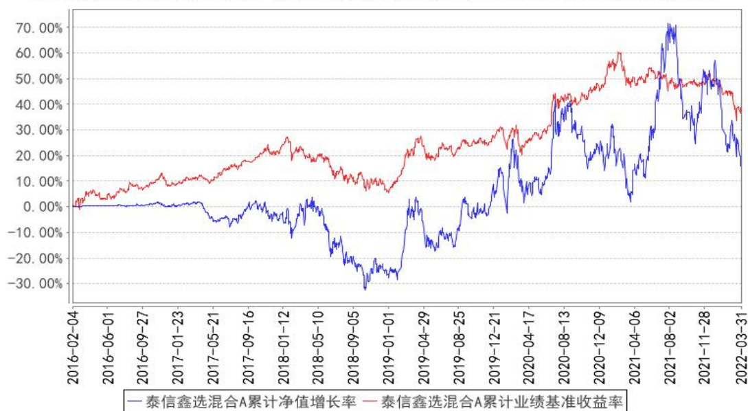
泰信鑫选混合A累计净值增长率与同期业绩比较基准收益率的历史走势对比图