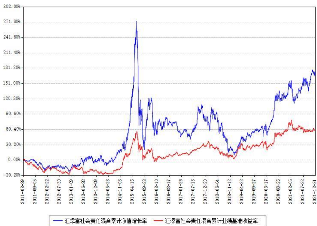
汇添富社会责任混合累计净值增长率与同期业绩基准收益率对比图