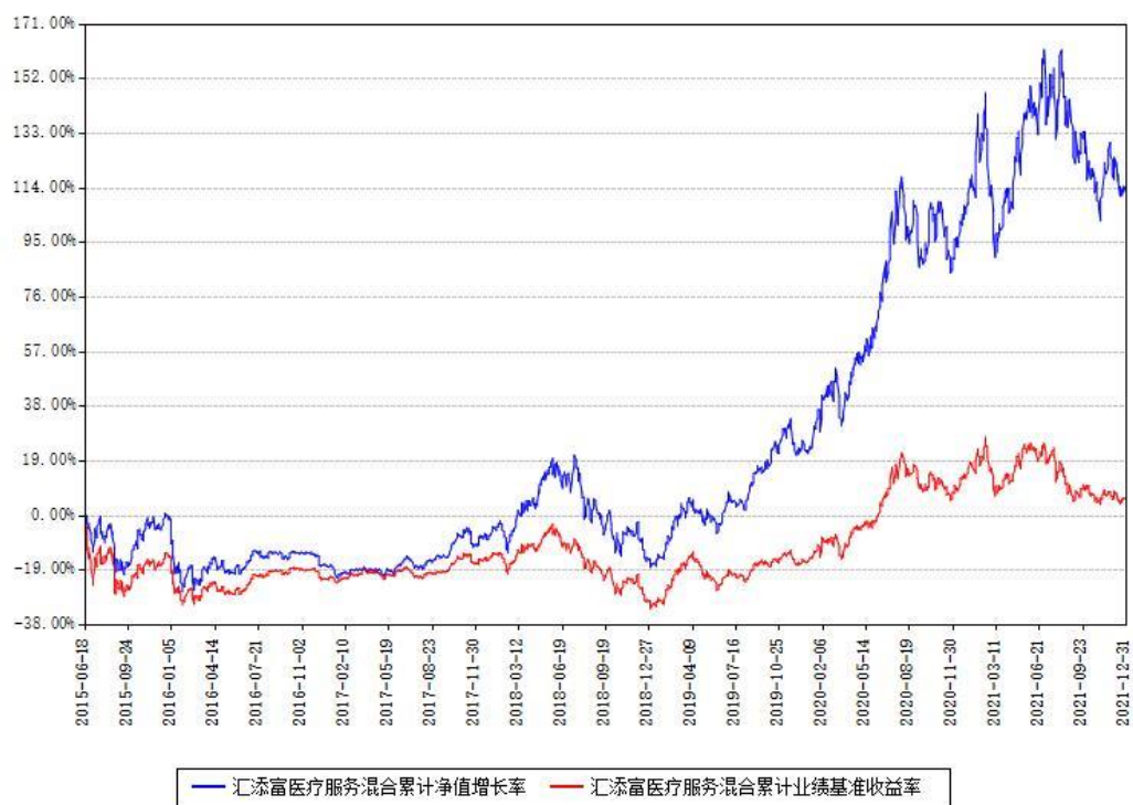
汇添富医疗服务混合累计净值增长率与同期业绩基准收益率对比图