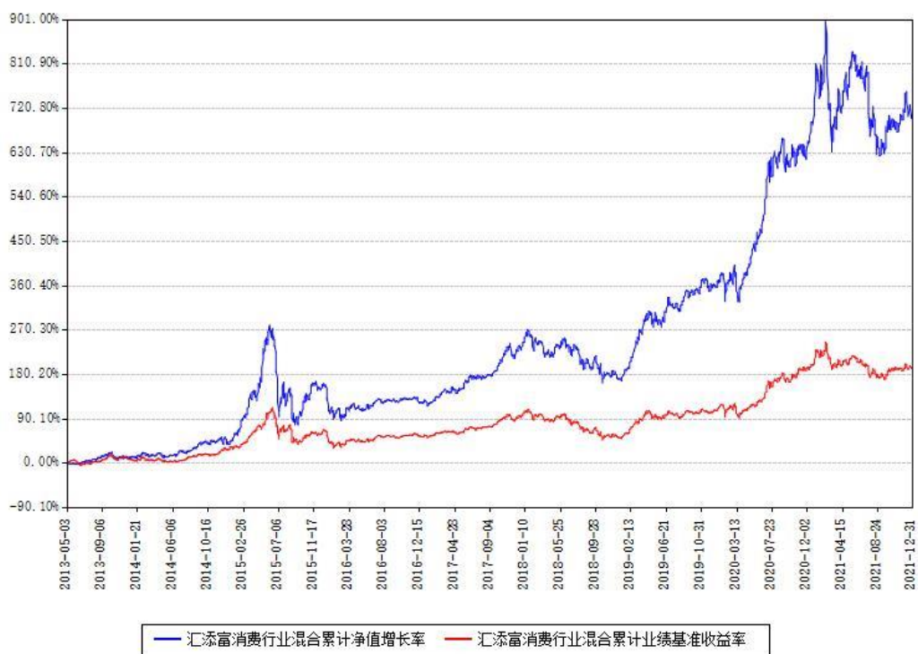
汇添富消费行业混合累计净值增长率与同期业绩基准收益率对比图