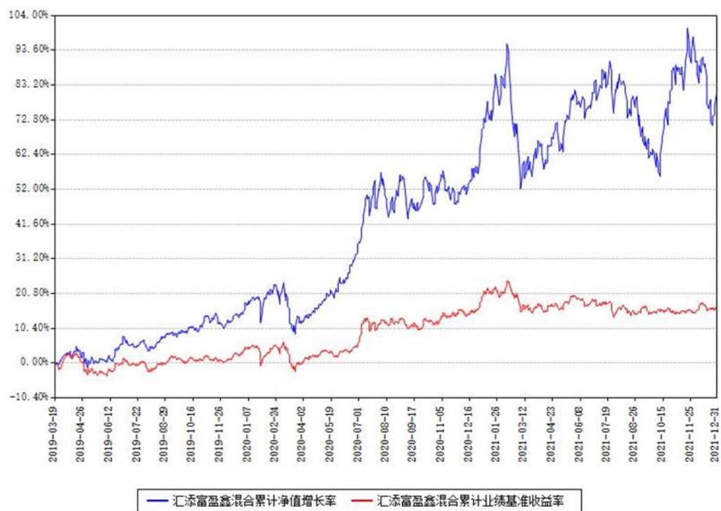
汇添富盈鑫混合累计净值增长率与同期业绩基准收益率对比图