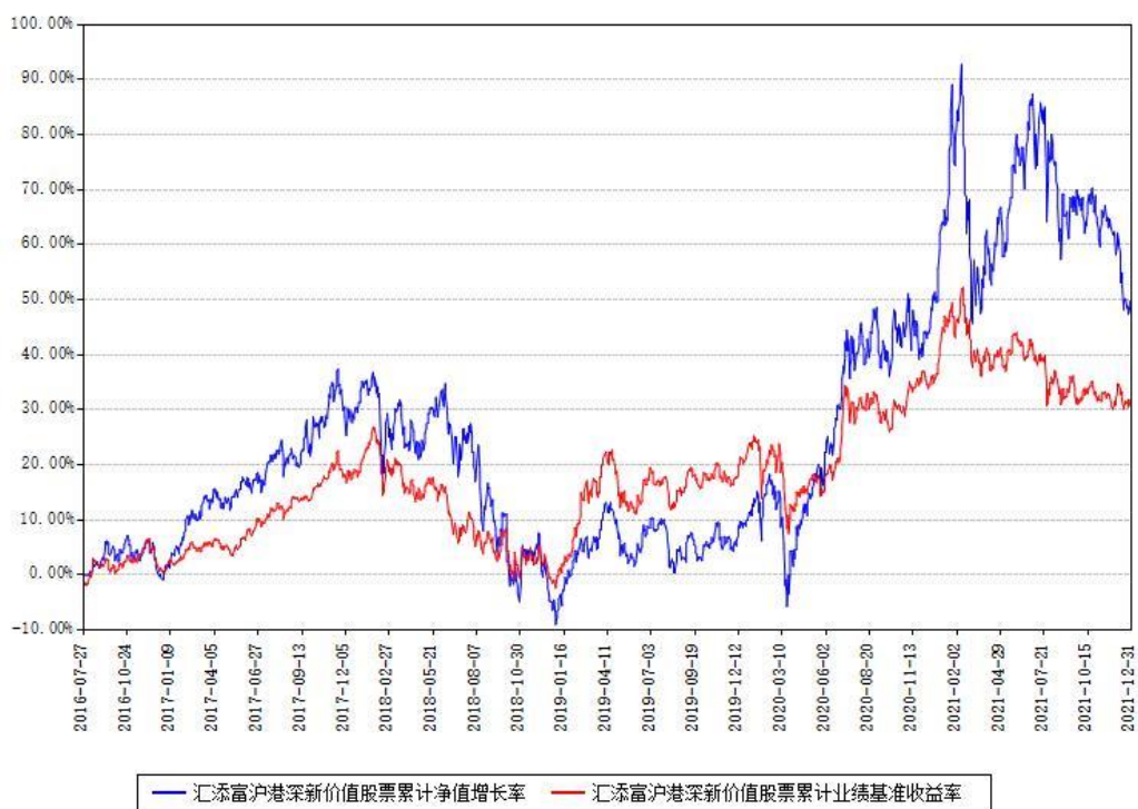
汇添富沪港深新价值股票累计净值增长率与同期业绩基准收益率对比图