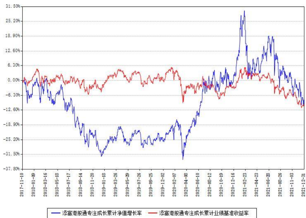
添富港股通专注成长累计净值增长率与同期业绩基准收益率对比图