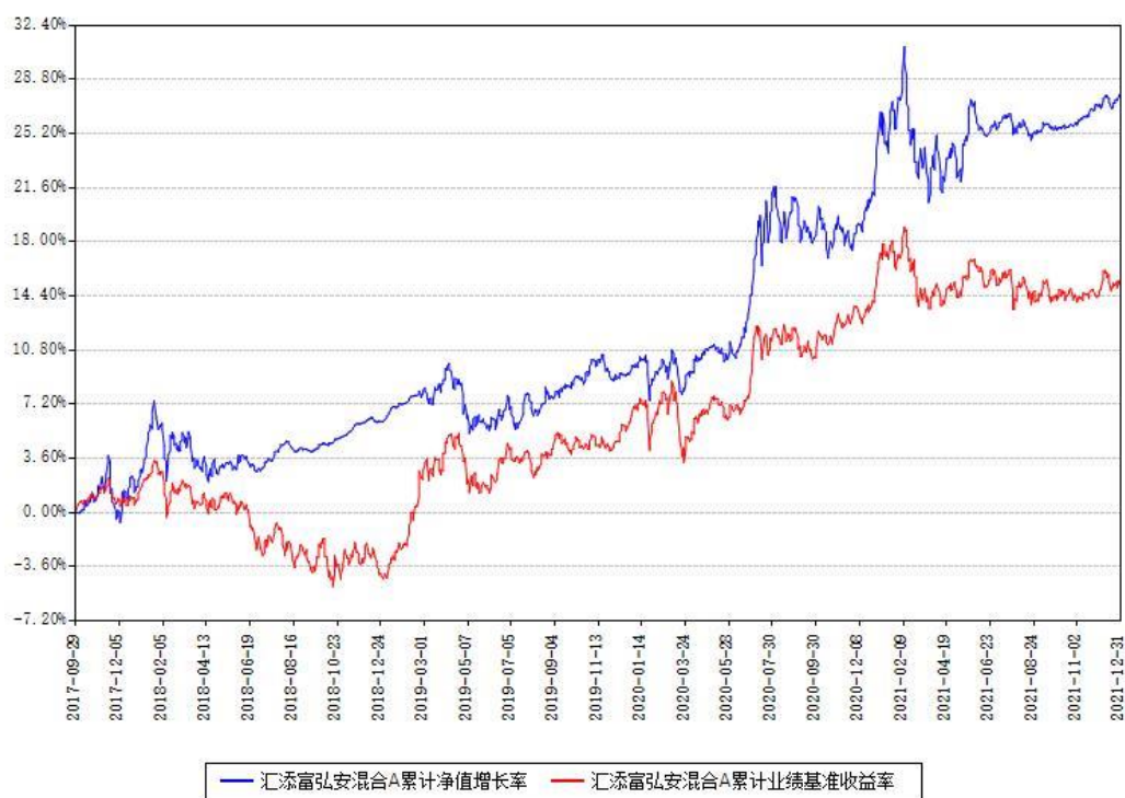
汇添富弘安混合A累计净值增长率与同期业绩基准收益率对比图