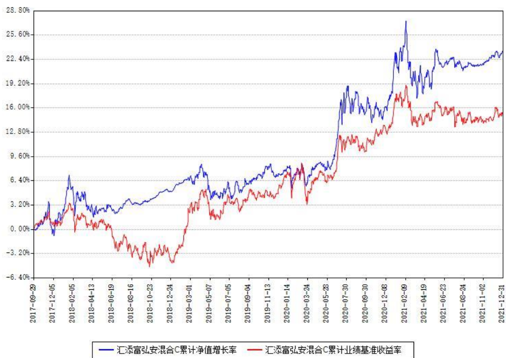
汇添富弘安混合C累计净值增长率与同期业绩基准收益率对比图