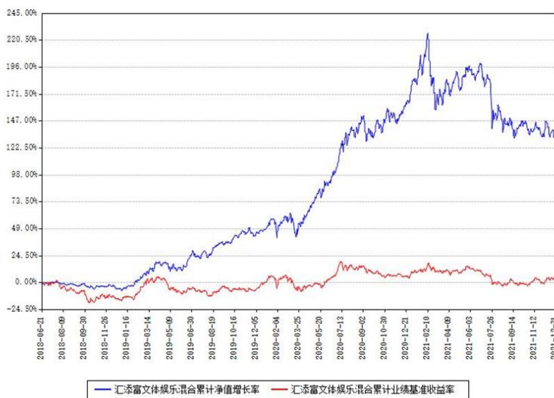
汇添富文体娱乐混合累计净值增长率与同期业绩基准收益率对比图

(二) 自基金合同生效以来基金累计净值增长率变动及其与同期业绩比较基准收益率变动的比较图