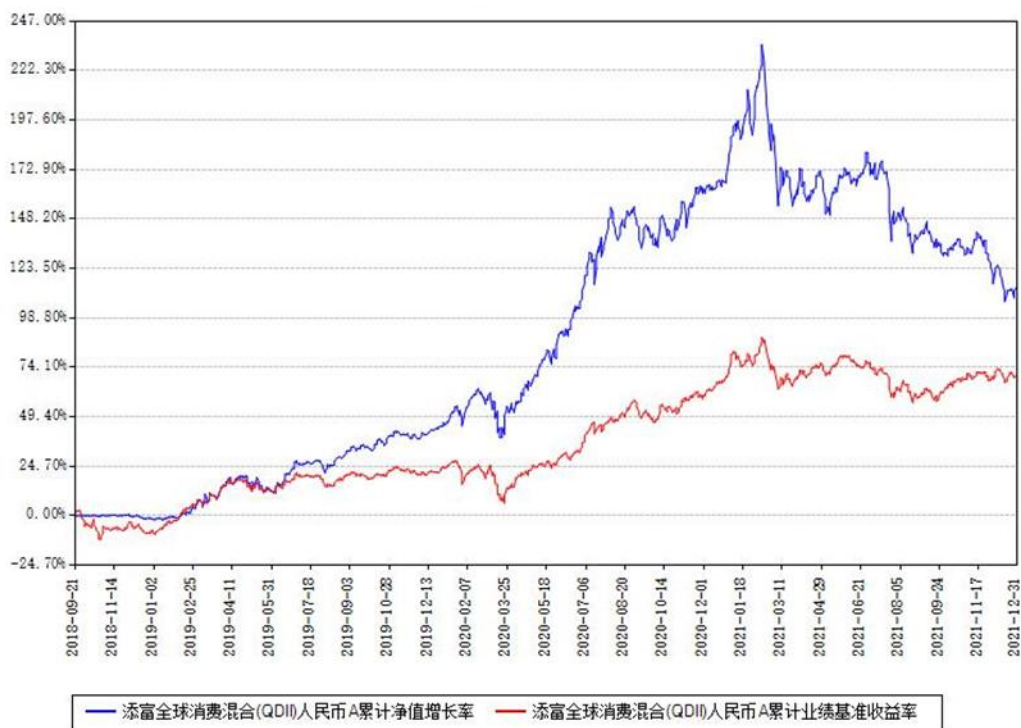
添富全球消费混合(QDII)人民币A累计净值增长率与同期业绩基准收益率对比图