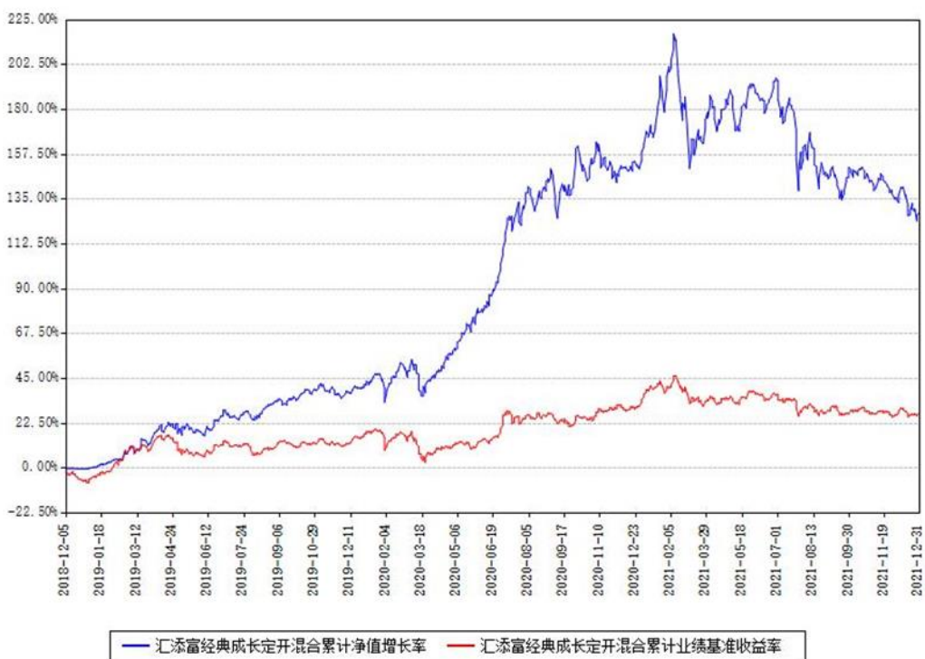
汇添富经典成长定开混合累计净值增长率与同期业绩基准收益率对比图