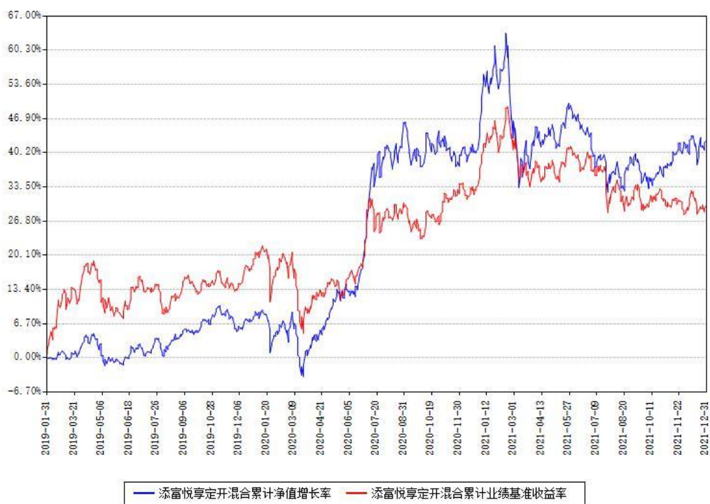
添富悦享定开混合累计净值增长率与同期业绩基准收益率对比图