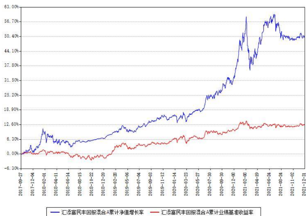
汇添富民丰回报混合A累计净值增长率与同期业绩基准收益率对比图