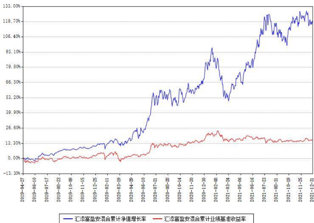
汇添富盈安混合累计净值增长率与同期业绩基准收益率对比图

(二) 自基金合同生效以来基金累计净值增长率变动及其与同期业绩比较基准收益率变动的比较图