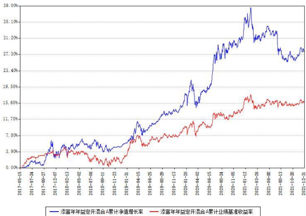
添富年年益定开混合A累计净值增长率与同期业绩基准收益率对比图