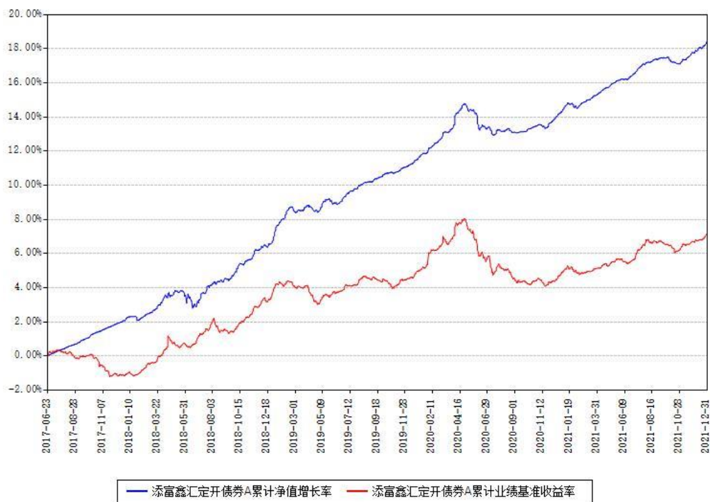
添富鑫汇定开债券A累计净值增长率与同期业绩基准收益率对比图