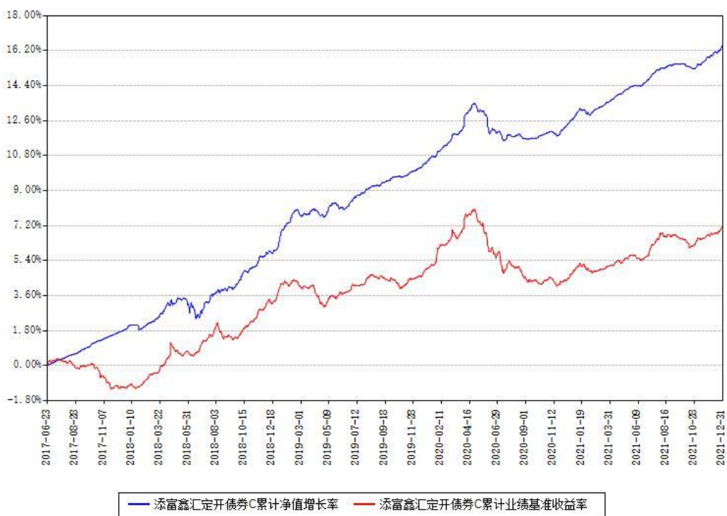
添富鑫汇定开债券C累计净值增长率与同期业绩基准收益率对比图