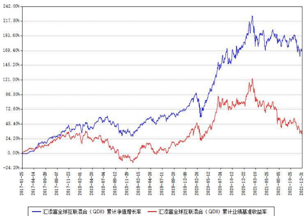
汇添富全球互联混合（QDII）累计净值增长率与同期业绩基准收益率对比图