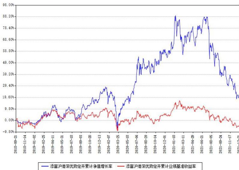
添富沪港深优势定开累计净值增长率与同期业绩基准收益率对比图

(二) 自基金合同生效以来基金累计净值增长率变动及其与同期业绩比较基准收益率变动的比较图