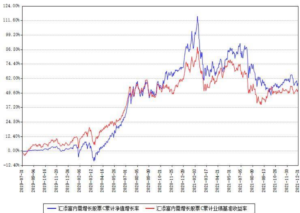
汇添富内需增长股票C累计净值增长率与同期业绩基准收益率对比图