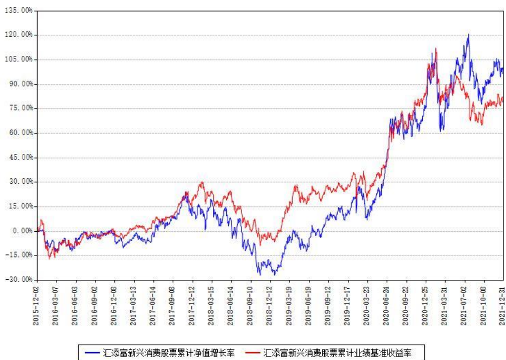
汇添富新兴消费股票累计净值增长率与同期业绩基准收益率对比图