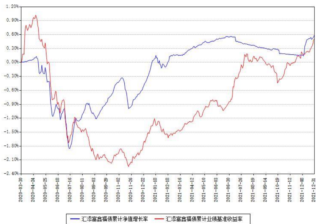
汇添富鑫福债累计净值增长率与同期业绩基准收益率对比图