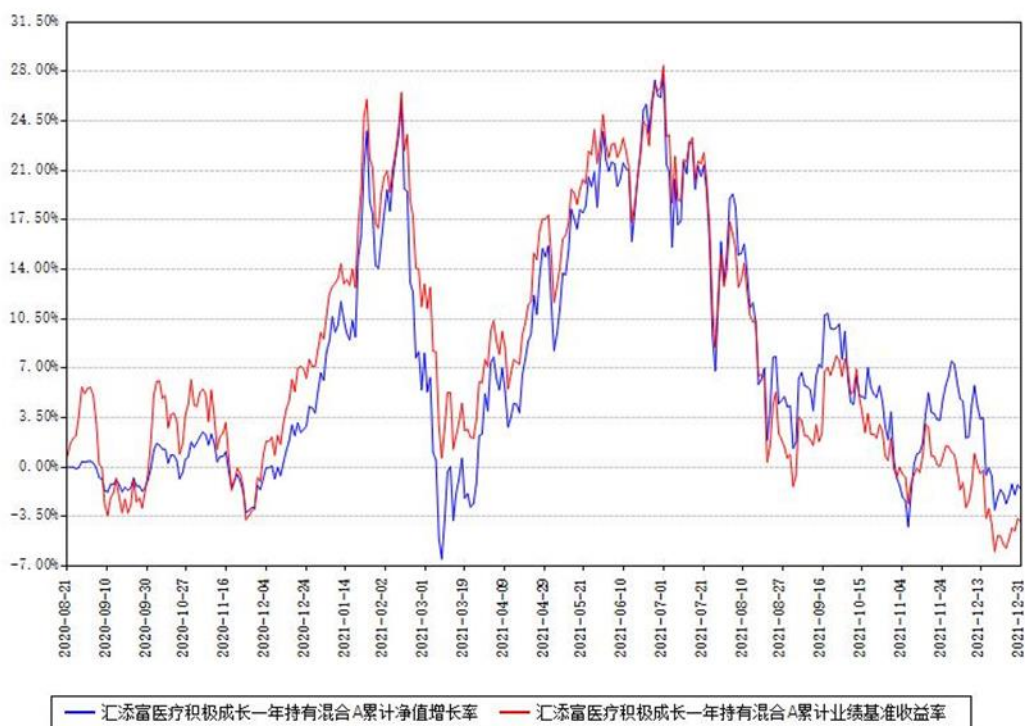
汇添富医疗积极成长一年持有混合A累计净值增长率与同期业绩基准收益率对比图