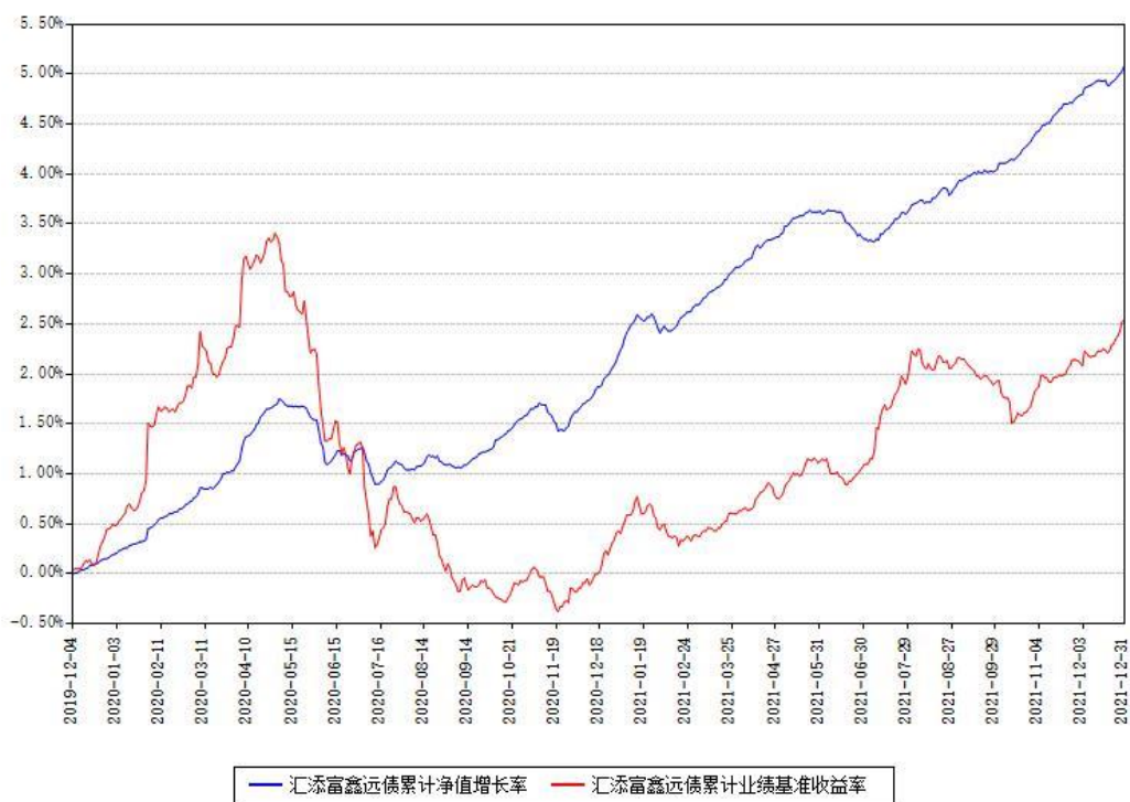
汇添富鑫远债累计净值增长率与同期业绩基准收益率对比图