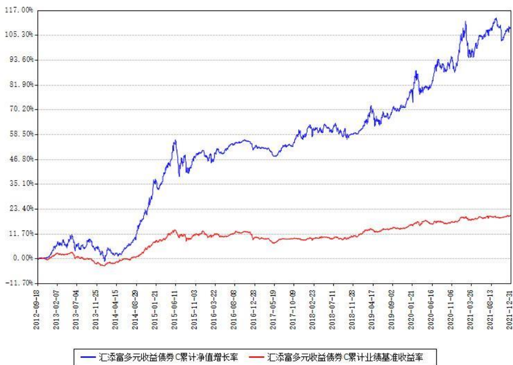
汇添富多元收益债券C累计净值增长率与同期业绩基准收益率对比图