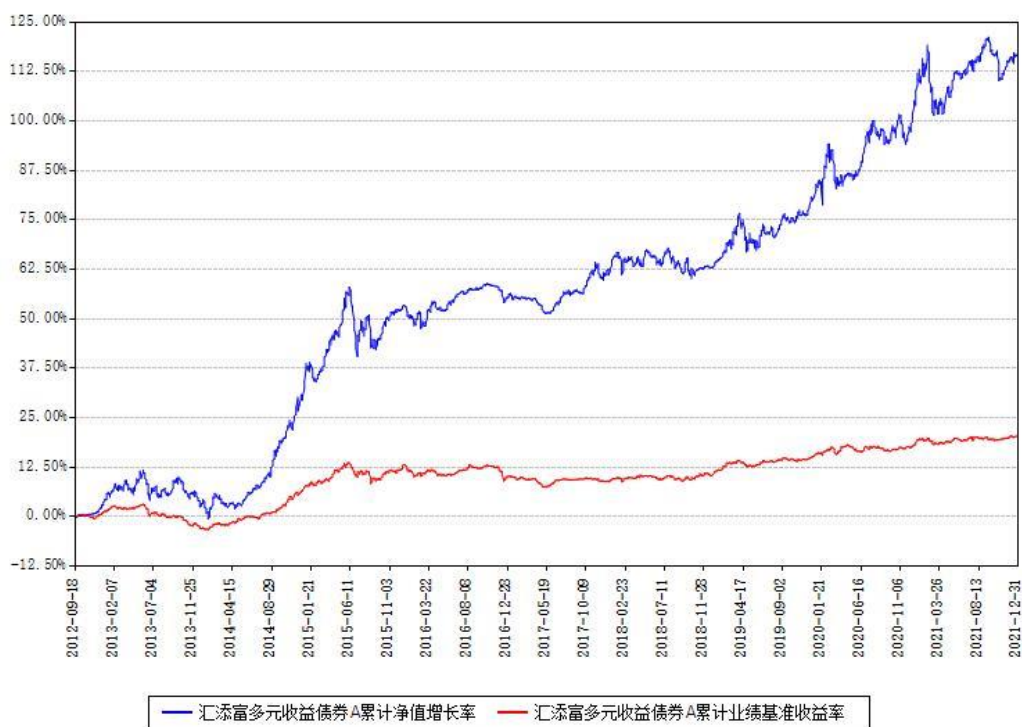
汇添富多元收益债券A累计净值增长率与同期业绩基准收益率对比图