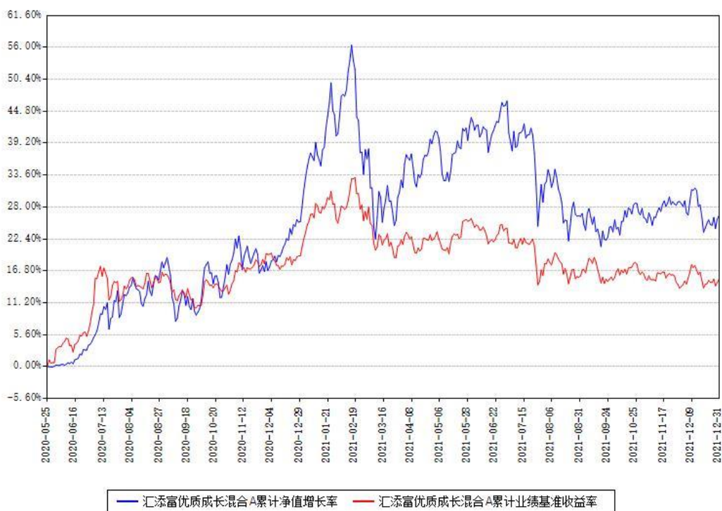
汇添富优质成长混合A累计净值增长率与同期业绩基准收益率对比图