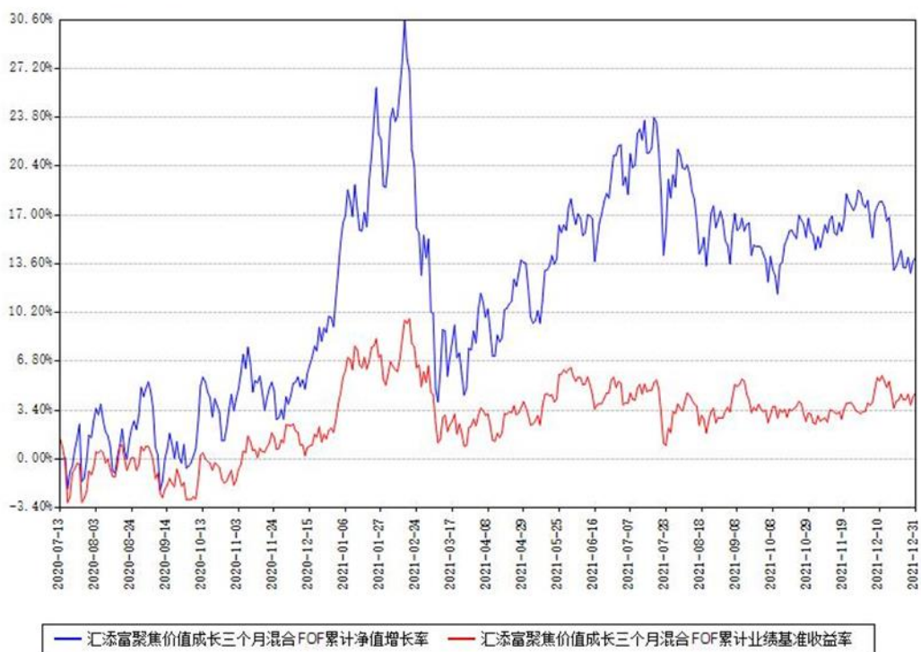
汇添富聚焦价值成长三个月混合FOF累计净值增长率与同期业绩基准收益率对比图