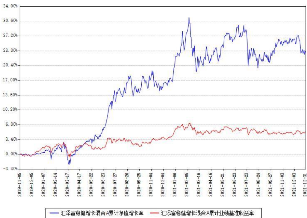
汇添富稳健增长混合A累计净值增长率与同期业绩基准收益率对比图