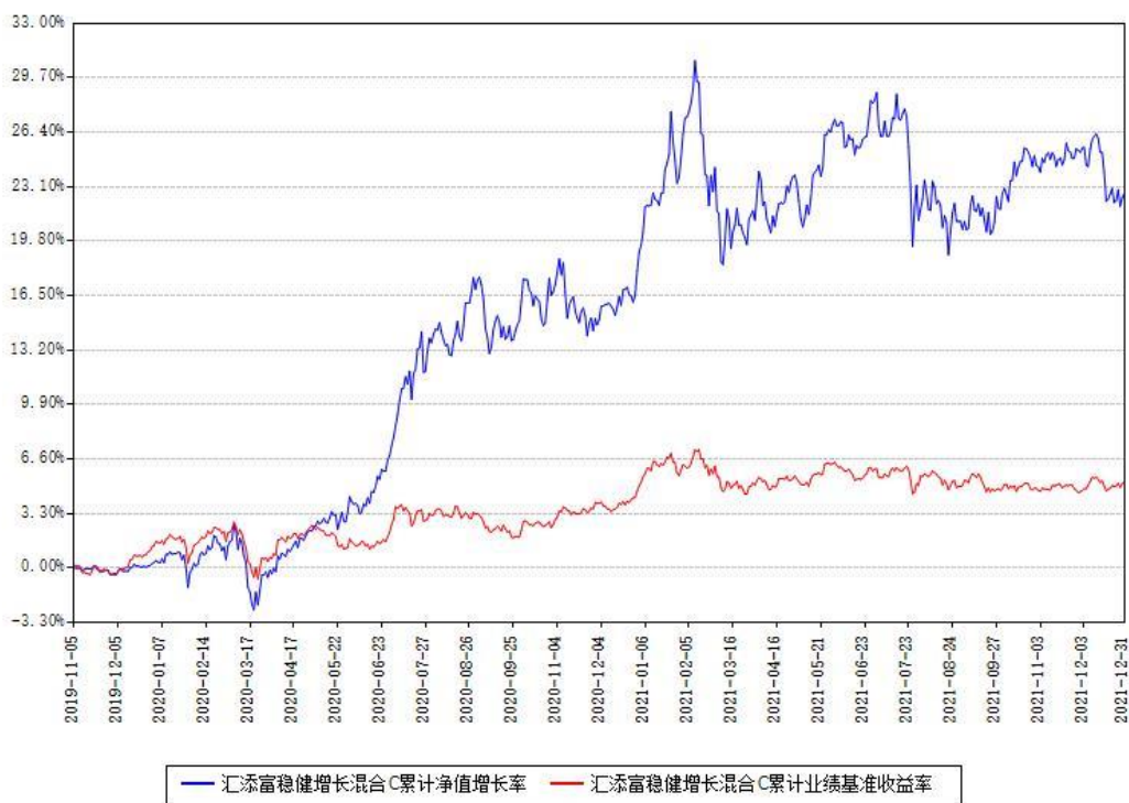
汇添富稳健增长混合C累计净值增长率与同期业绩基准收益率对比图