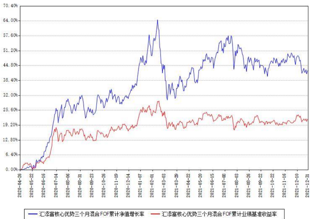
汇添富核心优势三个月混合FOF累计净值增长率与同期业绩基准收益率对比图