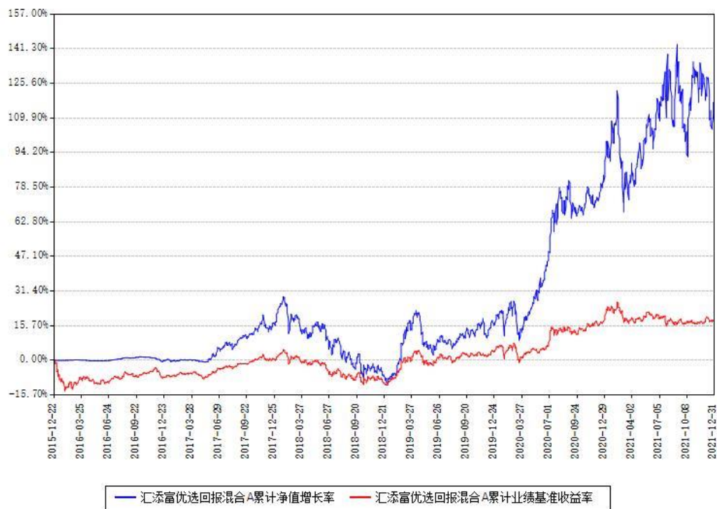
汇添富优选回报混合A累计净值增长率与同期业绩基准收益率对比图