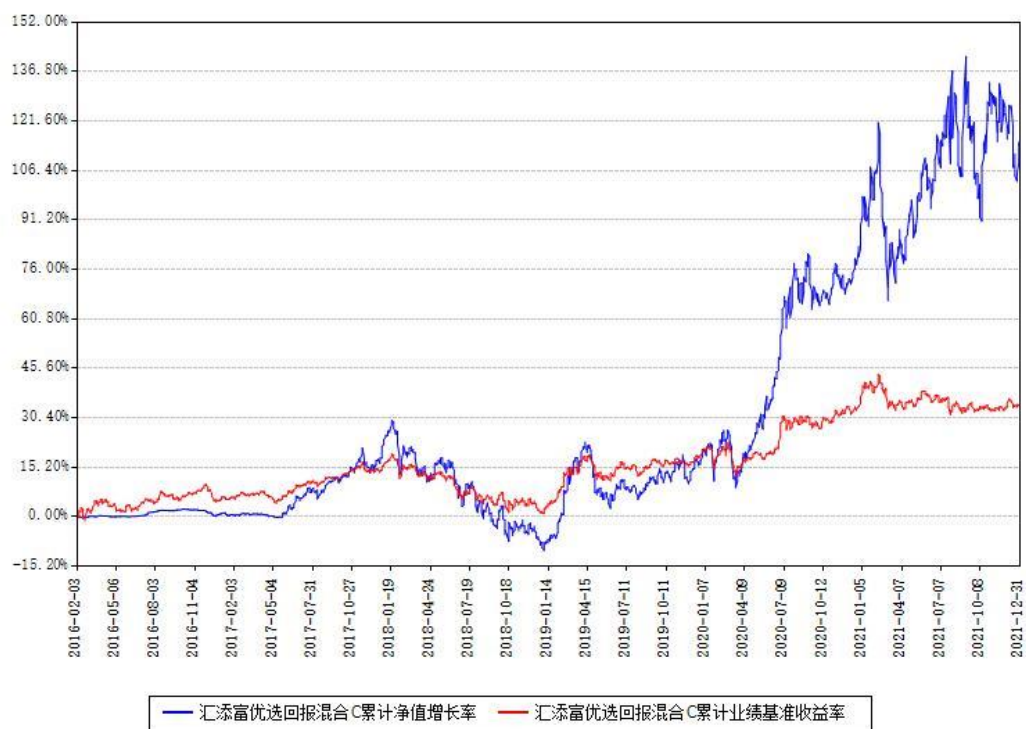
汇添富优选回报混合C累计净值增长率与同期业绩基准收益率对比图