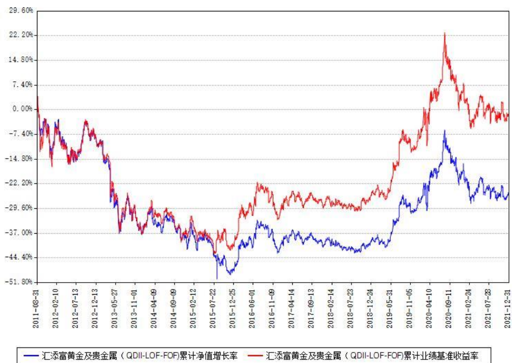
汇添富黄金及贵金属（QDII-LOF-FOF）累计净值增长率与同期业绩基准收益率对比图