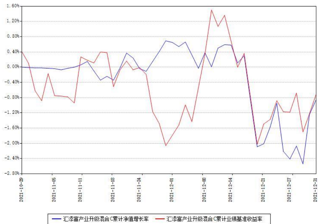
汇添富产业升级混合C累计净值增长率与同期业绩基准收益率对比图