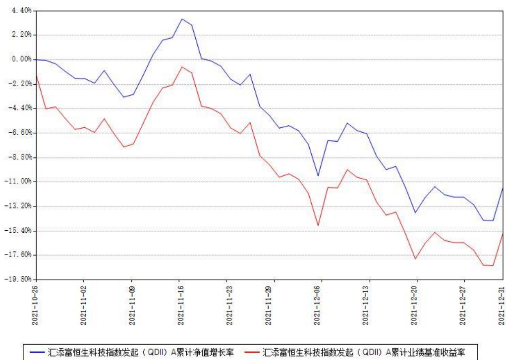
汇添富恒生科技指数发起（QDII）A累计净值增长率与同期业绩基准收益率对比图