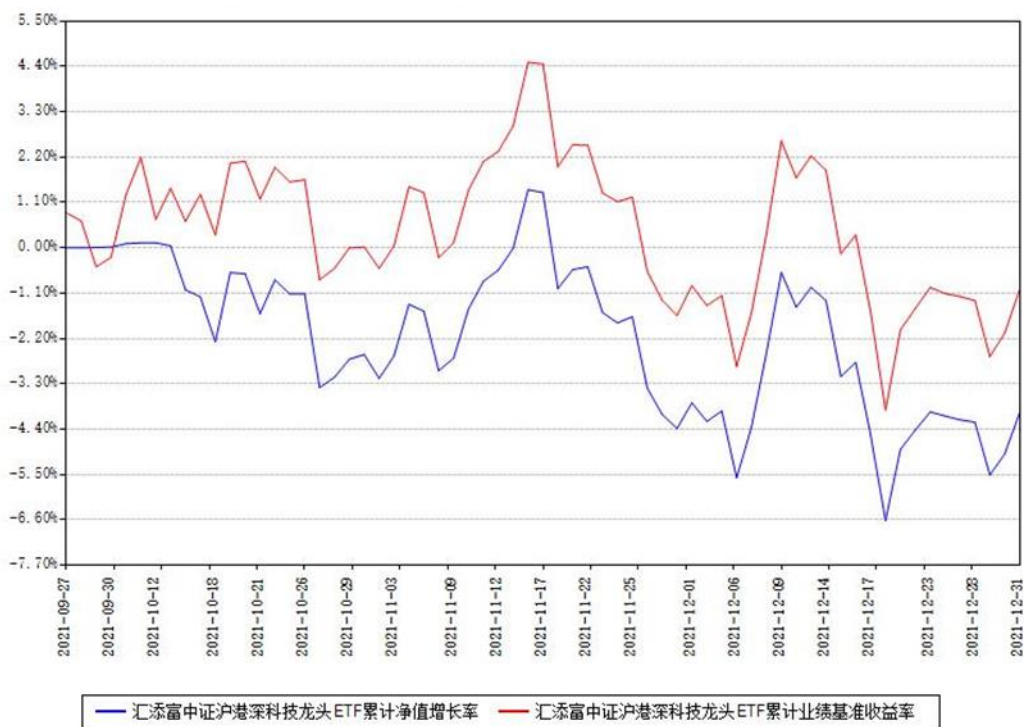
汇添富中证沪港深科技龙头ETF累计净值增长率与同期业绩基准收益率对比图