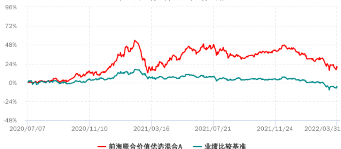
前海联合价值优选混合A累计净值增长率与业绩比较基准收益率历史走势对比图 (2020年07月07日-2022年03月31日)