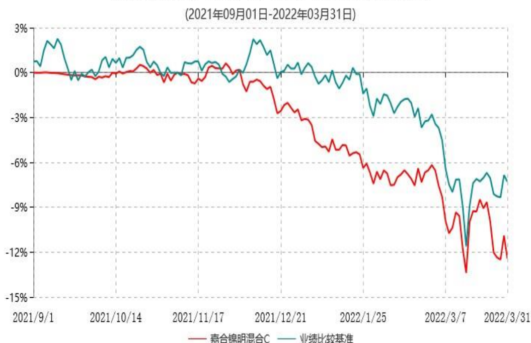
嘉合锦明混合C累计净值增长率与业绩比较基准收益率历史走势对比图

注：1、本基金基金合同于 2021 年 09 月 01 日生效。截至本报告期末，本基金基金合同生效不满一年。