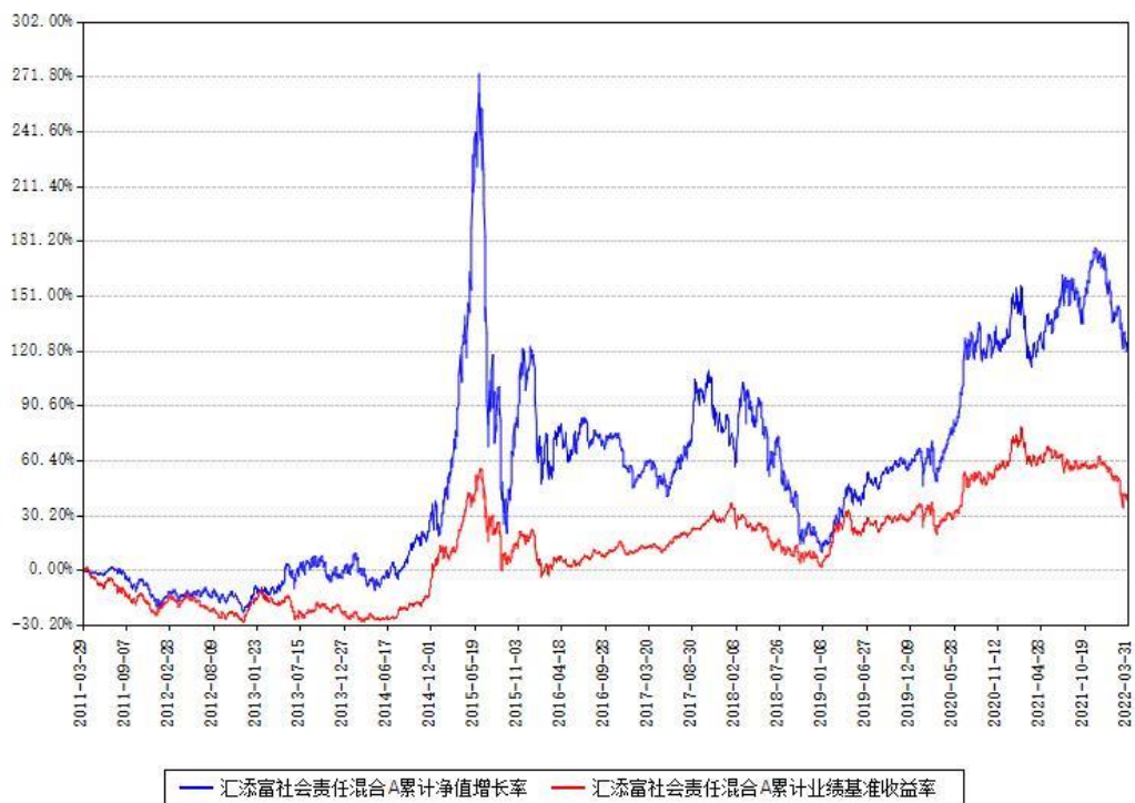
汇添富社会责任混合A累计净值增长率与同期业绩基准收益率对比图