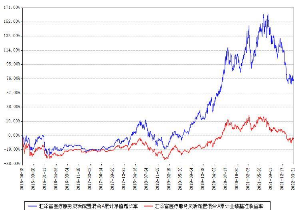
汇添富医疗服务灵活配置混合A累计净值增长率与同期业绩基准收益率对比图