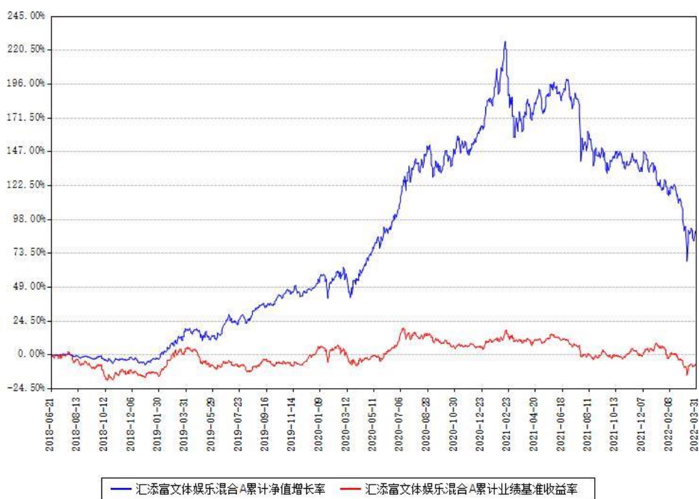
汇添富文体娱乐混合A累计净值增长率与同期业绩基准收益率对比图