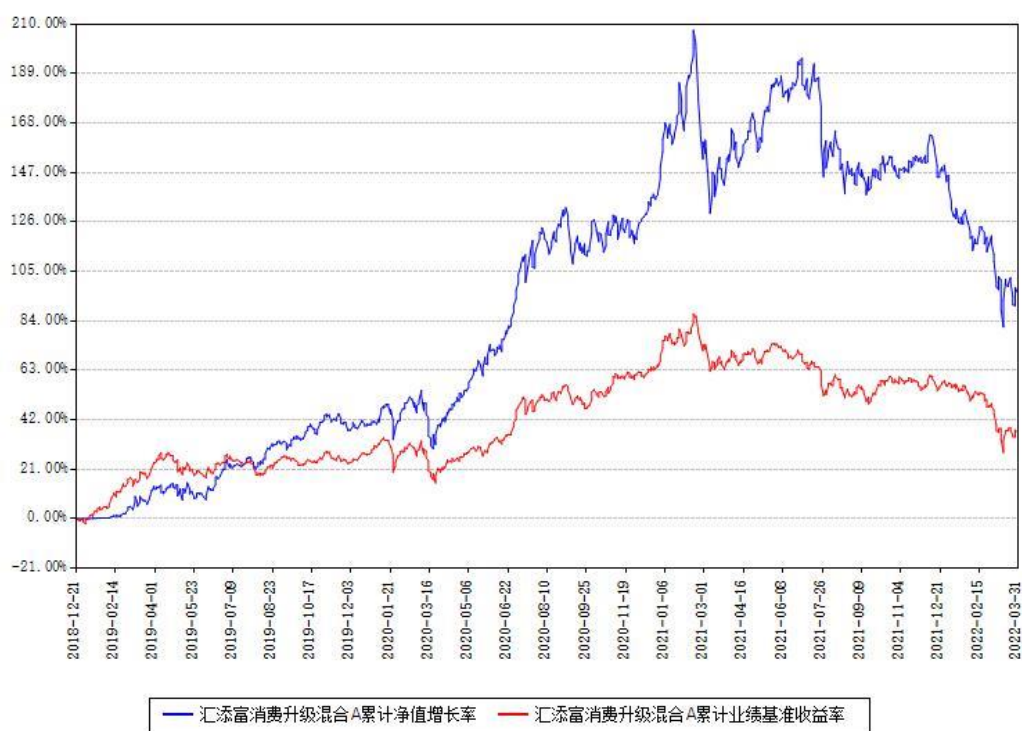
汇添富消费升级混合A累计净值增长率与同期业绩基准收益率对比图