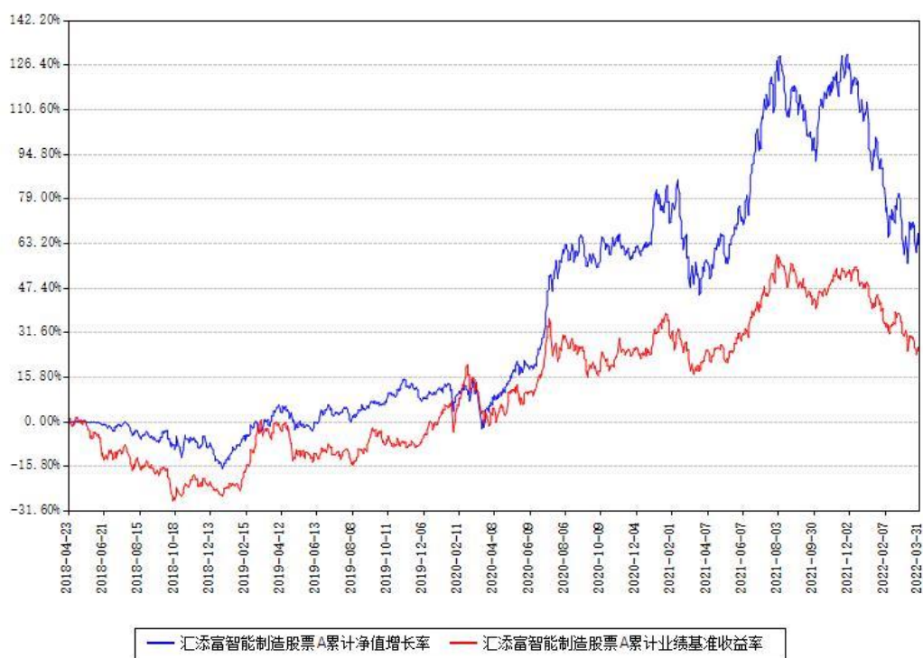
汇添富智能制造股票A累计净值增长率与同期业绩基准收益率对比图