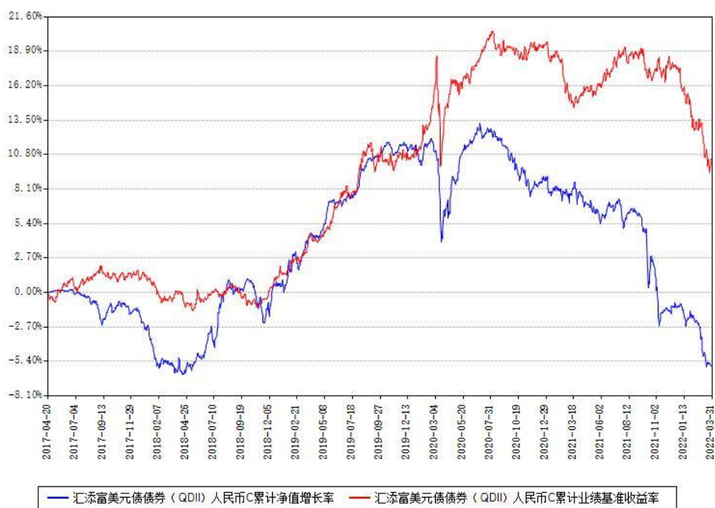
汇添富美元债债券（QDII）美元现汇A累计净值增长率与同期业绩基准收益率对比图